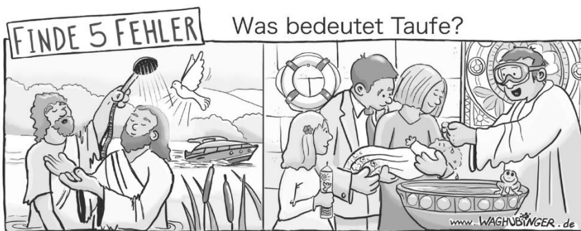
Duschkopf, Motorboot, Rettungsring, Taufbecken, Taucherbrille, Frosch

später als Erwachsener nicht. Doch noch wichtiger als die Gemeinschaft der Christen ist die Gemeinschaft mit Gott. Bei der Taufe heißt es: „Ich taufe dich im Namen des Vaters, des Sohnes und des Heiligen Geistes.“ Gott nimmt mich in der Taufe an als ein geliebtes Kind. So war es auch bei der Taufe Jesu. Dort sagt Gott zu seinem Sohn: „Du bist mein geliebter Sohn.“ Und durch die Taufe wird auch heute jeder Mensch – also auch ihr – ein Kind Gottes. Das ist wunderbar, denn so sind wir immer bei Gott geborgen, wie ihr Kinder bei euren Eltern geborgen seid. Auch dann noch, wenn ihr längst erwachsen seid und vielleicht eigene Kinder habt – wir bleiben immer Kinder Gottes, egal, wie alt wir sind.